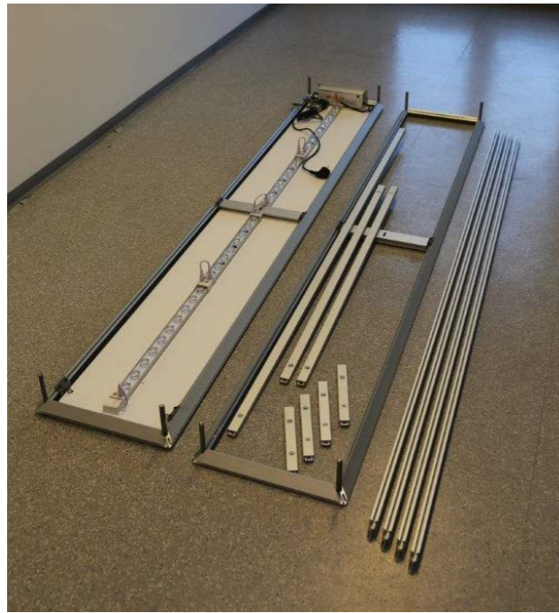
1: フレームと金具を確認します。