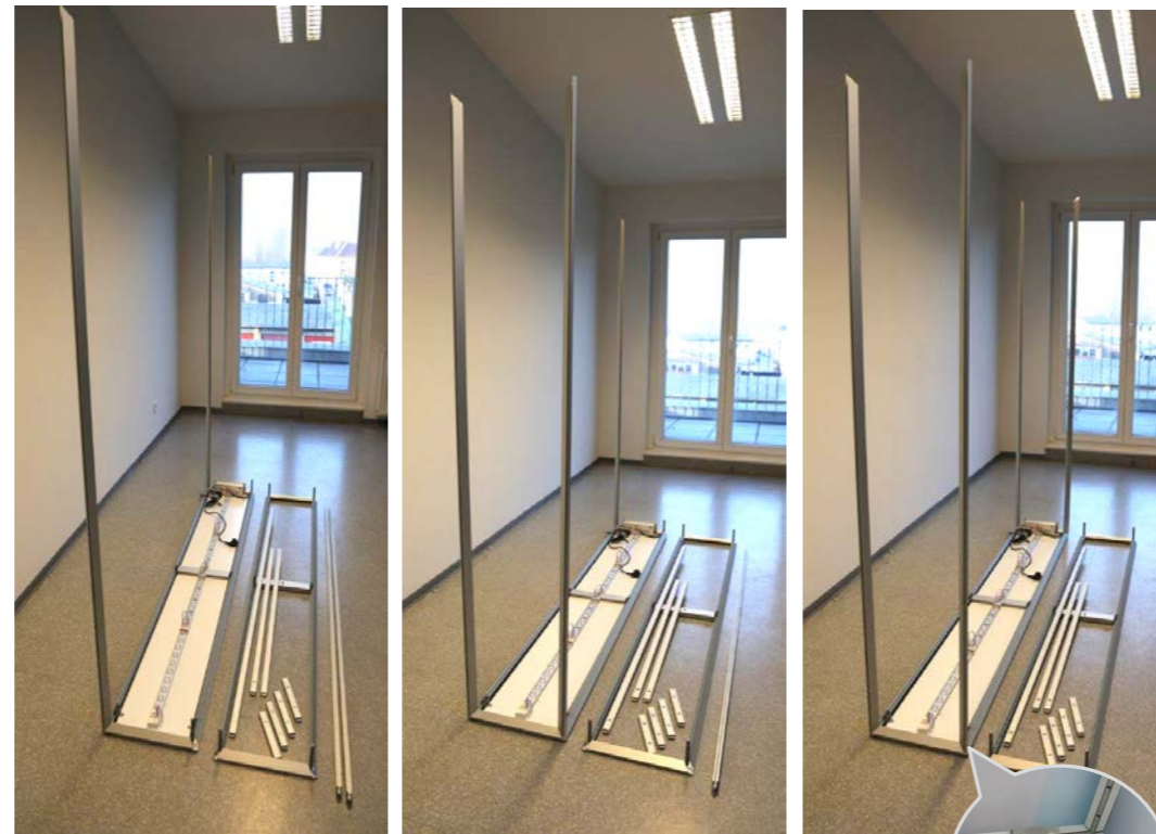
2: 最初に4本の縦フレームを取付けます。