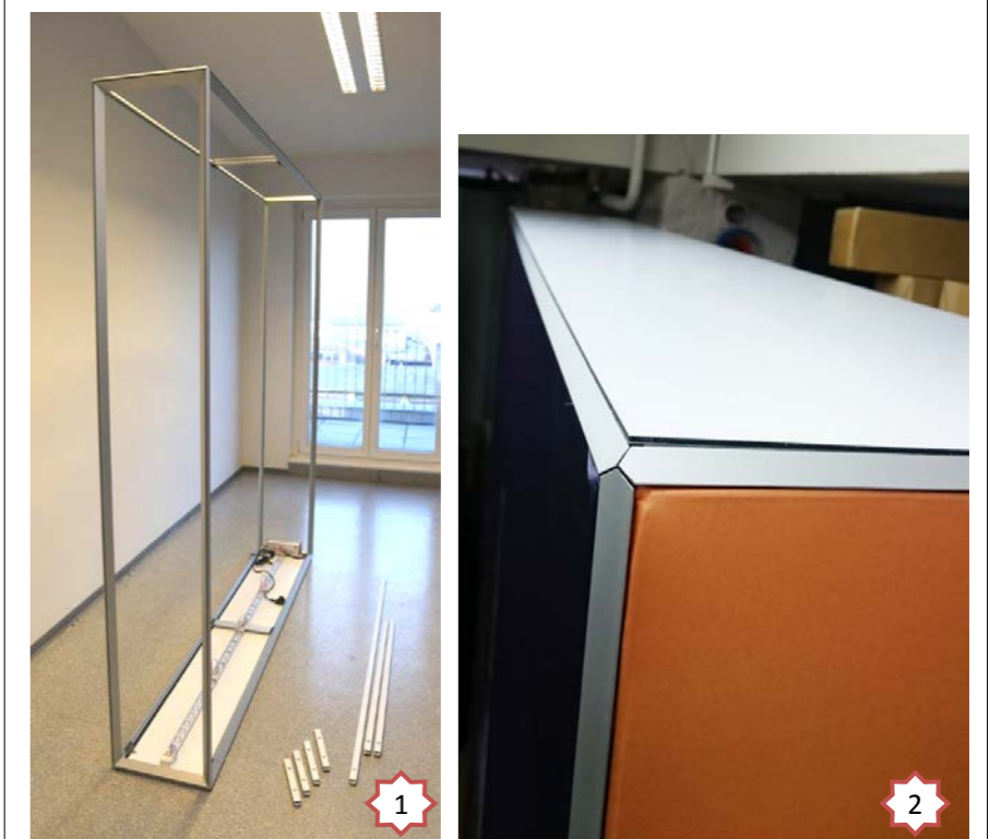
3: 上部フレームを取付けます。