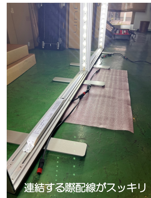
連結する際配線がスッキリ